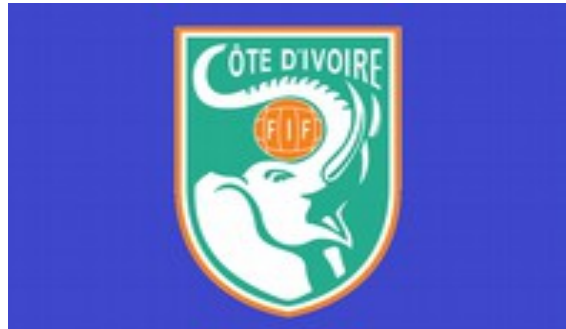
Costa de Marfil

Lub-InfoK mira como ejemplo el partido Costa de Marfil contra Mozambique. El primer día de Navidad, el 25 de diciembre, se ganó cómodamente 1:0 (Mozambique). Quién ganará esta vez la Copa Africana de Fútbol en Marruecos todavía está por verse. Para Europa y sus ojeadores de fútbol, África es una fuente inagotable de talentos.