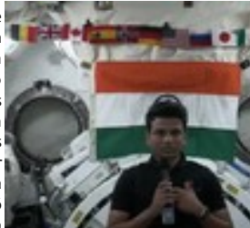
Credit NASA/ ISS TV 7-2025 ISS-Spacestation EE. UU.- 10-2025 Club-InfoK -

Se considera el programa de aterrizaje europeo más famoso en un cuerpo celeste extranjero, con el nombre corto 67P y el mucho más largo de los dos descubridores de la década de 1960 de la Unión Soviética, con los nombres Churyumov-Gerasimenko (primer nombre Svetlana ). Svetlana Gerasimenko (*1945 URSS ) falleció en abril de 2025 tras una vida plena dedicada a la astronomía y se la considera la descubridora de este cometa en placas fotográficas.