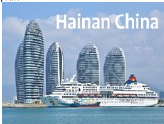
Imagen simbólica de la apertura de China: isla de Hainan con barcos de turismo

En el año 2022, Italia obtuvo el puesto 13 en la clasificación general en Pekín 2022. Suecia había querido originalmente ofrecer los Juegos Olímpicos 2026 y ocupó el puesto 5 en China. España logró al menos el puesto 25 en Asia en los Juegos Olímpicos de Invierno, Suiza el puesto 8. Austria el puesto 7 y la región montañosa del oeste alemán de los Alpes se situó en Asia en el puesto 2, detrás de Noruega (puesto 1). Hungría consiguió 3 medallas y obtuvo el puesto 20.