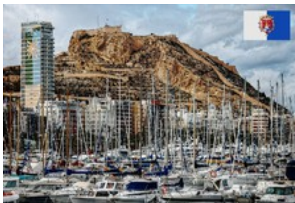
Puerto de Alicante