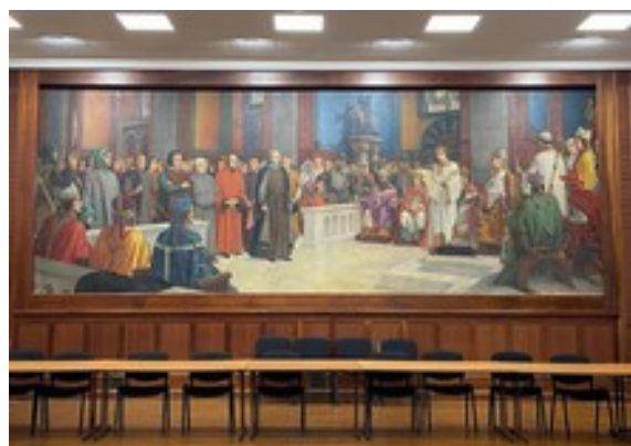
Imagen simbólica Pintura de 1289 de la universidad y del Papa

En la imagen, una familia del Imperio Bizantino (hace 1000 años) con María, emperatriz de Manuel I. De este entorno familiar provenía también el importante conquistador de Mallorca y la región de Valencia, entonces contra los moros españoles, llamado 'Jaume el Conquistador'.