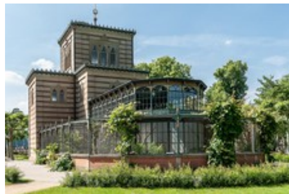
Anekdot: Estilo arquitectónico morisco en el zoológico de Stuttgart, Alemania Anekdot: Maurischer Baustill im Zoo in Stuttgart GER

Este Festival Internacional 2025 se celebró bajo el lema 130 años de cine y 120 de cine en China. A partir del 18 de diciembre de 2025, el puerto de libre comercio de la isla de Hainan fue reorganizado, lo cual fue un tema importante también en el festival de cine 2025. Un tema de descubrimiento de cultura y cine en Asia y China.