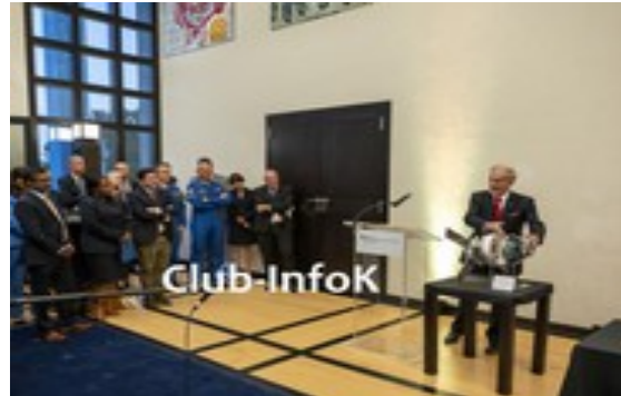
Adhesión de Alemania/ Beitritt Deutschland Washington Sept. 2023

América y Europa – En el vuelo Artemis-2, a partir de febrero de 2026, se espera que por primera vez una tripulación vuelva a volar alrededor de la Luna terrestre, pero sin aterrizar allí. Según se indica, la nave espacial Soyuz ya pudo hacer esto en su momento, aunque de la competencia. Sin embargo, a nivel internacional todavía no hay consenso sobre si entonces fue con personal o como vuelo vacío; las naves Soyuz han orbitado la Luna. El módulo de servicio Artemis-Orion con propulsión de Europa se considera la contribución europea. Los alemanes ( organización DLR ) esperan, según sus propias declaraciones, formar parte de un equipo lunar.