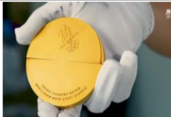
Imagen medalla Milán-Cortina 2026

Esta zona, a veces denominada la Unión Francesa, también incluía las lejanas Madagascar y Kourou en Sudamérica. En Francia se dice que los habitantes de estos territorios también podrían ser ciudadanos franceses.