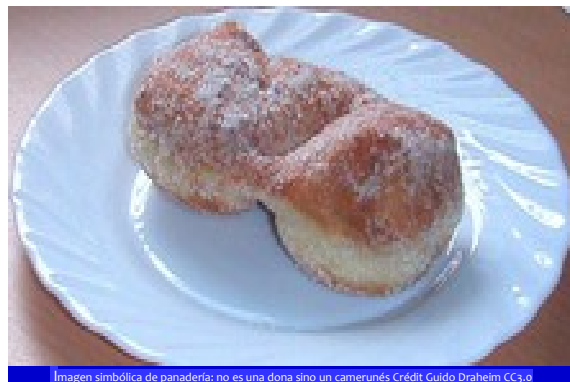
Imagen simbólica de panadería: no es una dona sino un camerunés