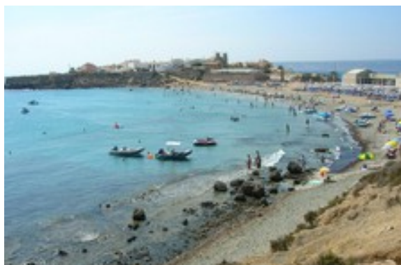
Isla Tabarca (en la provincia de Alicante, España)