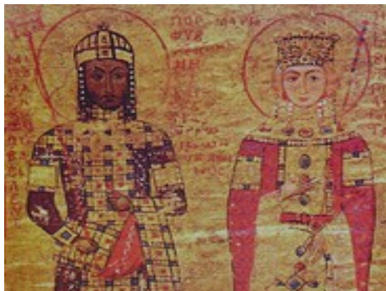
Imagen simbólica Época de Manuel I Comnenos y María de Antioquia

En los anuncios previos de la feria de turismo 2026 se trata de culturas locales catalanas, tradiciones de Cataluña y Barcelona , temas culturales para el marketing turístico, aventura, gastronomía y vida, así como transporte. La feria deberá tener como tema una oferta turística amplia.