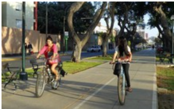
PEDALEA SEGURO/ Crédito Imagen decisio.nl/ Lima-Peru